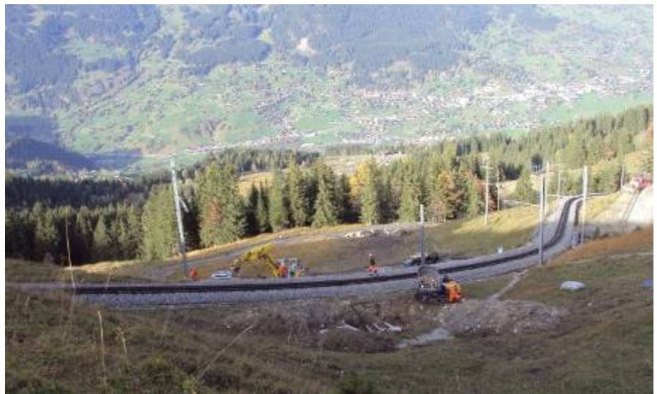
Vue sur le chantier. Les quatre fourreaux sont déjà posés. En arrière-plan, le village de Grindelwald.