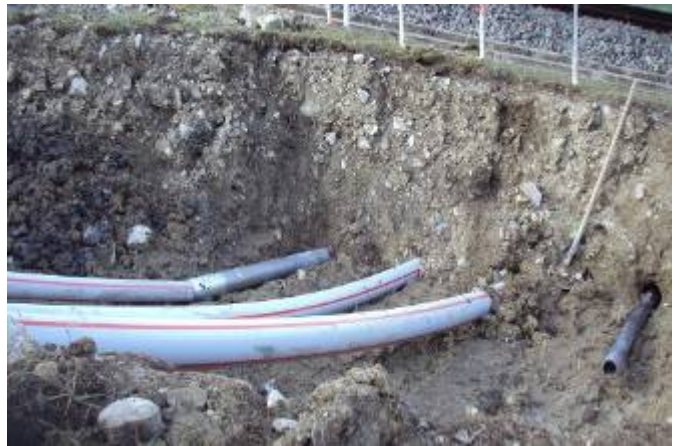
Les trois premiers fourreaux sont déjà posés, et le fonceur TERRA est prêt pour la quatrième passage.