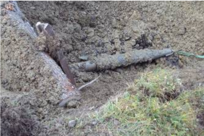
Le fonceur TERRA avec l'élargisseur et le fourreau attaché atteint la fouille d'arrivée.